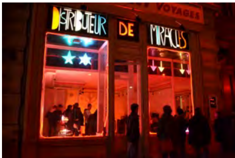
Distributeur des Miracles